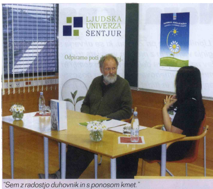
»Sem z radostjo duhovnik in s ponosom kmet.«